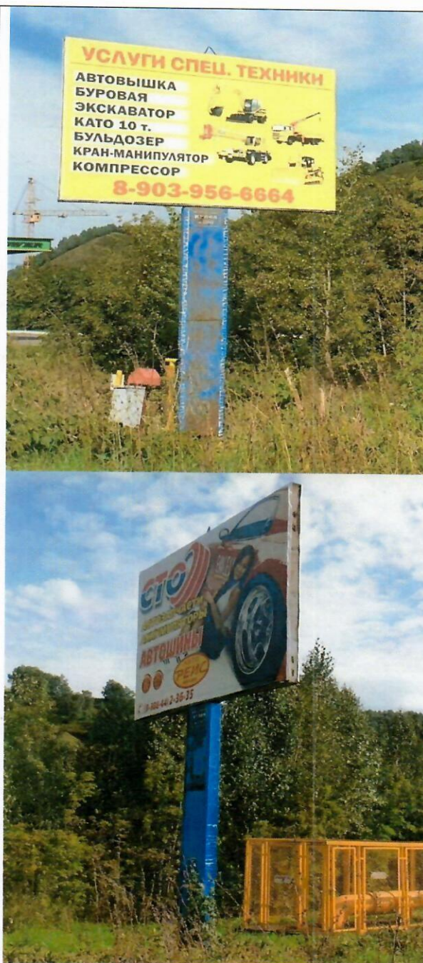
Фото рекламной конструкции

«30» сентября 2024 года отделом архитектуры и градостроительства Администрации муниципального образования «Майминский район» выявлена рекламная конструкция, установленная и (или) эксплуатируемая без разрешения, срок действия которого не истек, установленного по адресу (в случае отсутствия технической возможности определить точное местоположение, указывается ориентировочное расположение): в границах земельного участка с кадастровым номером 04:01:000000:733, Республика Алтай, Майминский район, с. Майма, ул. Алтайская, район дома № 2 Ж (слева):