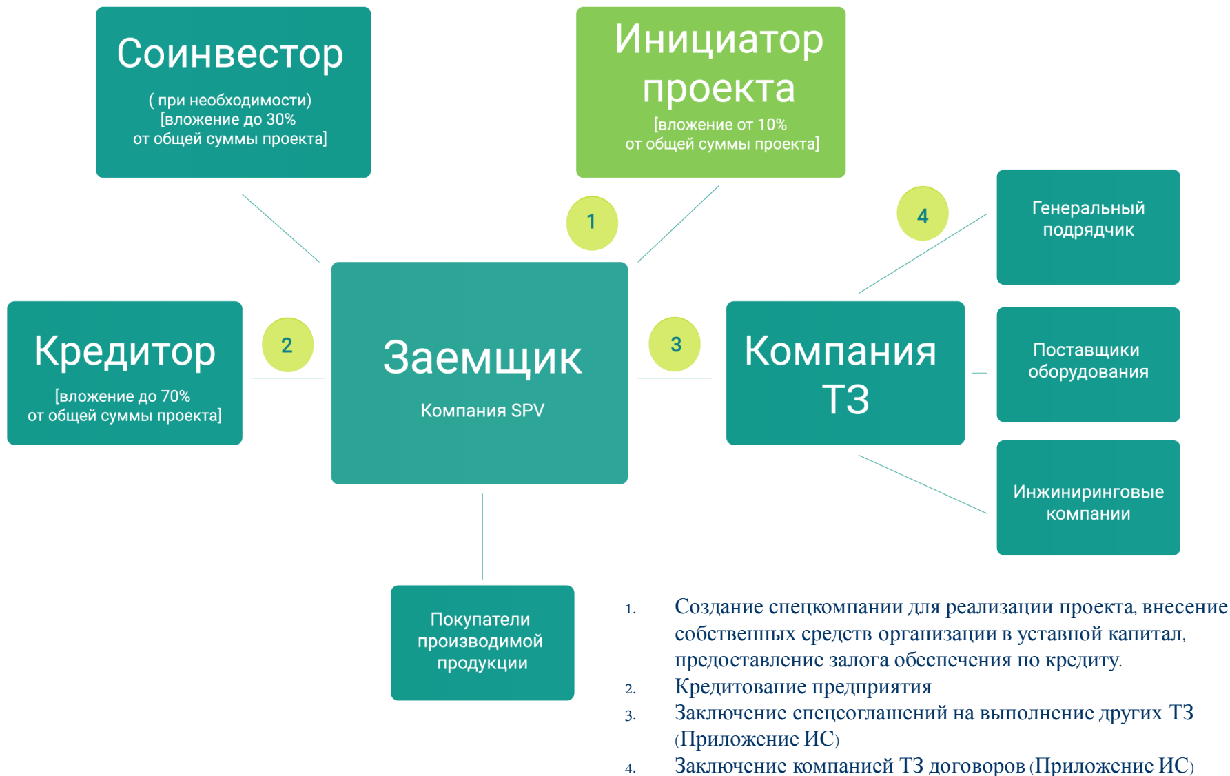
Схема реализации проекта в рамках Конкурса